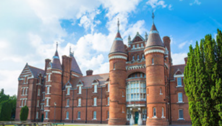
PORTSMOUTH MUSEUM AND ART GALLERY

Vanaf de aankomst van gedenkwaardige schepen tot omslagpunten in beide wereldoorlogen en zelfs een Koninklijke bruiloft, Portsmouth heeft het allemaal gezien. We bevinden ons misschien maar op een klein eiland, maar we hebben een grootse geschiedenis.