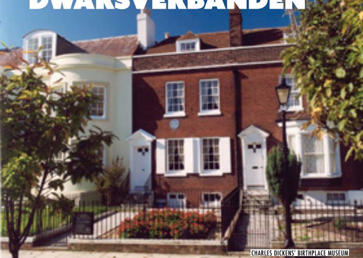
CHARLES DICKENS' BIRTHPLACE MUSEUM