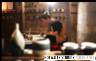
HOTWALLS STUDIOS ©DAN BOSS