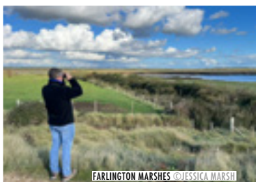
FARLINGTON MARSHES

Milton Common is een wat wildere plek met een combinatie van natuurlijke graslanden, struiken en vijvers. Wandel door een netwerk aan paden en afhankelijk van de tijd van het jaar kom je hier zwaluwen, gierzwaluwen, huiszwaluwen, waterhoen, kuifeenden, vossen, uilen en torenvalken tegen.