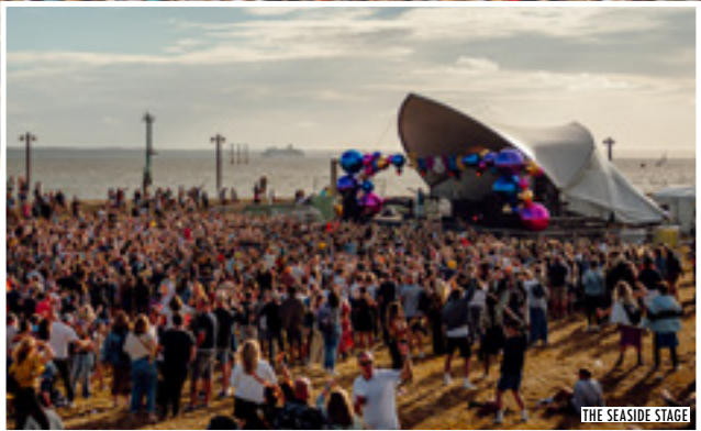
THE SEASIDE STAGE