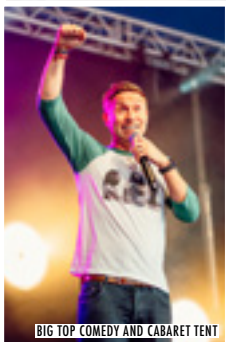
BIG TOP COMEDY AND CABARET TENT