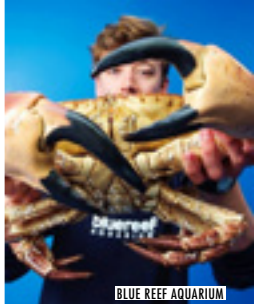
BLUE REEF AQUARIUM

In 2025 zullen er grootscheepse werkzaamheden worden uitgevoerd aan de zeeeringen waardoor grote delen van de weg langs de boulevard gesloten zullen zijn. De beste parkeerplaats voor het Blue Reef Aquarium is de parkeerplaats voor de D-Day Story, op maar een paar minuten lopen. Vanuit het westen heb je nog steeds gemakkelijk toegang langs een overdekt voetpad op Southsea Common.