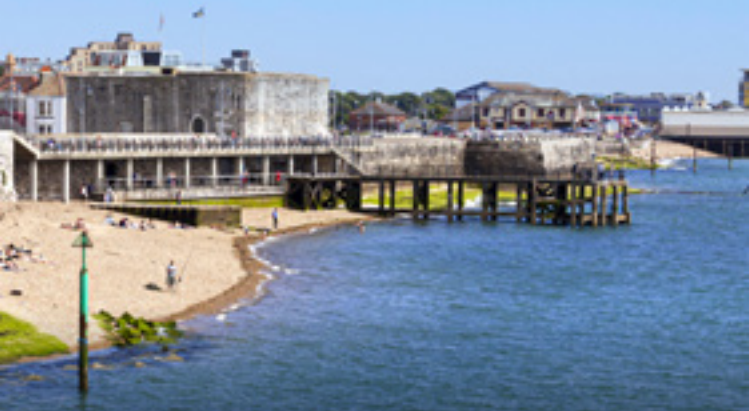
ROUND TOWER, SQUARE TOWER AND HOTWALLS BEACH