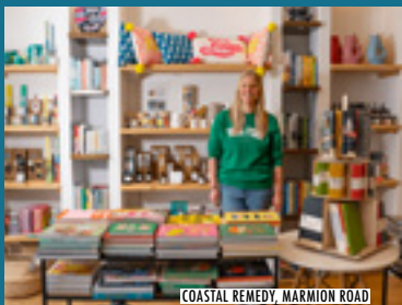
COASTAL REMEDY, MARMION ROAD

Portsmouth heeft ook verschillende retailparken die ruimte bieden aan grotere winkelbedrijven, zoals Ocean Retail Park, North Harbour en het Pompey Centre.