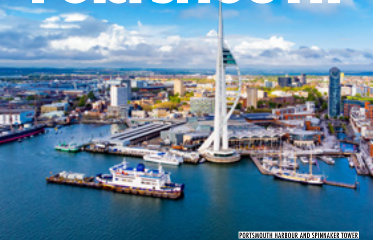
PORTSMOUTH HARBOUR AND SPINNAKER TOWER

Portsmouth, de enige eilandstad in het Verenigd Koninkrijk, is de perfecte locatie voor uw volgende korte vakantie of dagtrip.