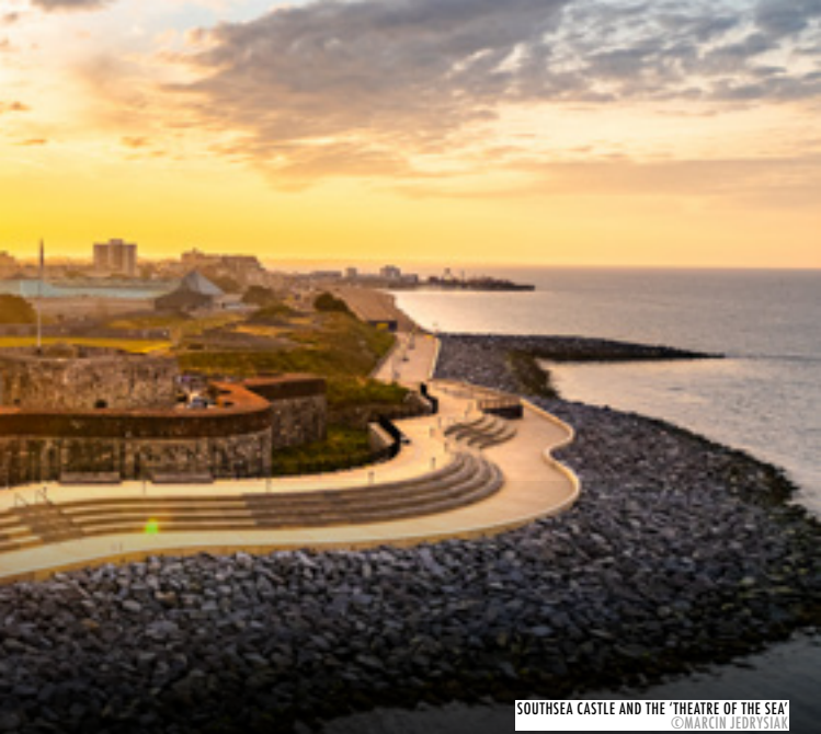
SOUTHSEA CASTLE AND THE 'THEATRE OF THE SEA'

genoeg ruimte om hun honden lekker zonder riem te laten rondrennen.