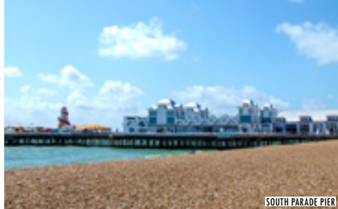
SOUTH PARADE PIER