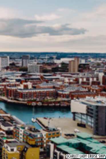
SCARLET LADY CRUISE SHIP