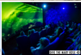
DIVE THE MARY ROSE 4D