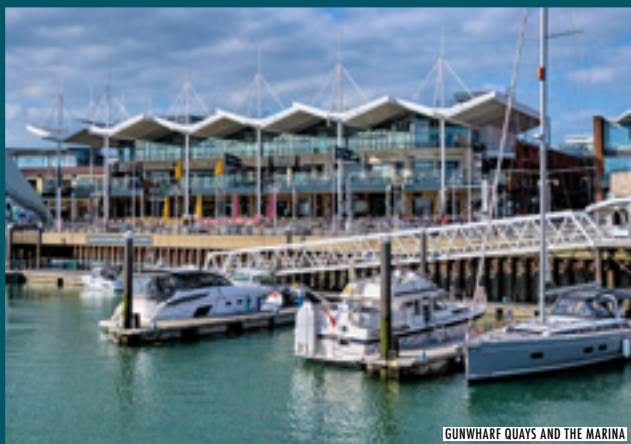
GUNWHARF QUAYS AND THE MARINA