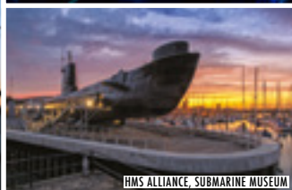
HMS ALLIANCE, SUBMARINE MUSEUM