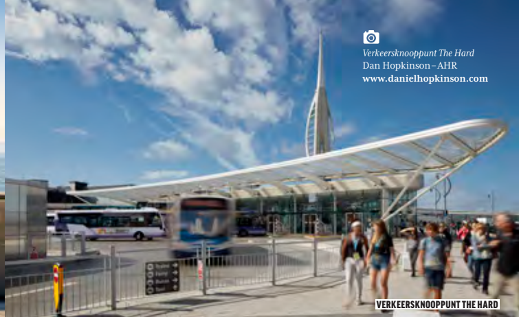
Verkeersknooppunt The Hard