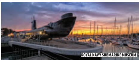
ROYAL NAVY SUBMARINE MUSEUM

En u bent met de trein of bus binnen anderhalf uur al in Londen, dus dat is perfect voor een dagexcursie.