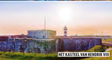
HET KASTEEL VAN HENDRIK VIII