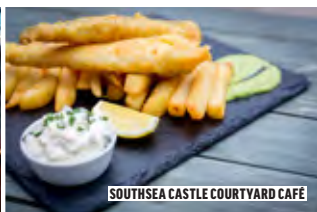
SOUTHSEA CASTLE COURTYARD CAFÉ