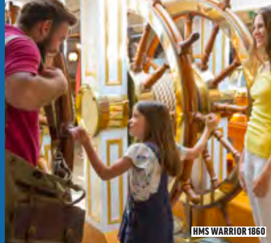
HMS WARRIOR 1860