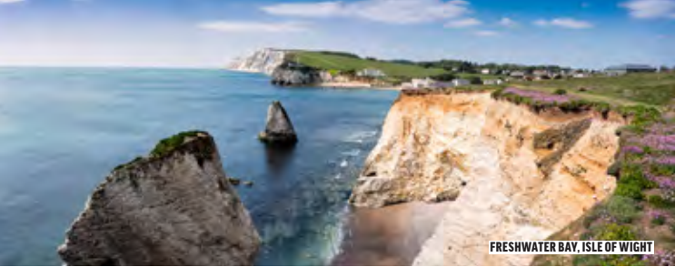
FRESHWATER BAY, ISLE OF WIGHT