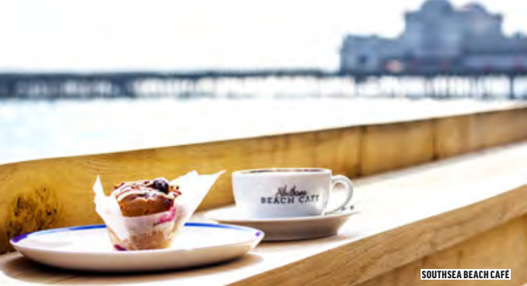
SOUTHSEA BEACH CAFÉ