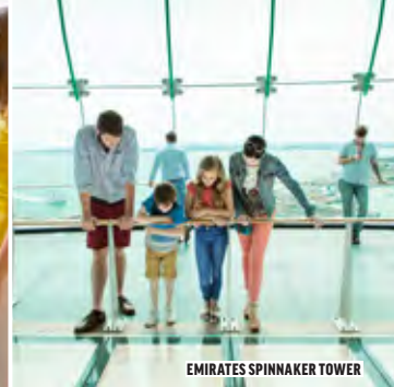
EMIRATES SPINNAKER TOWER