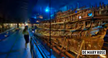
DE MARY ROSE